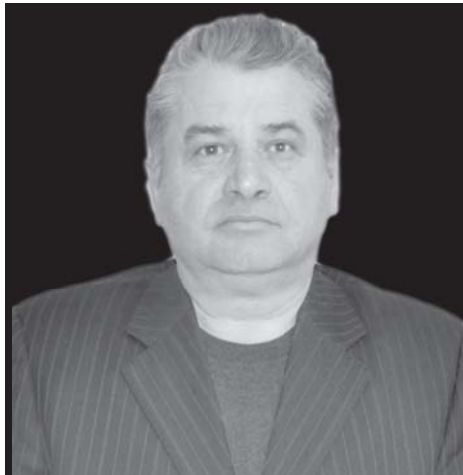
20 апреля на 64-ом году ушёл из жизни достоинейший человек–

Продам рассаду помидоров. Тел.: 8-929-455-57-15.